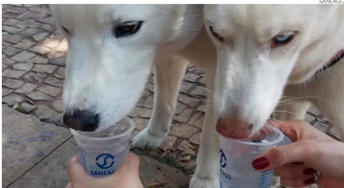
Saneago possui espaço de socialização na Praça Cívica aos domingos: distribuição gratuita de água

Em datas comemorativas, como o Dia da Árvore, o Dia Mundial da Água, o Dia do Meio Ambiente e o aniversário da Companhia, dentre outros, a Saneago realiza eventos especiais. Nas ocasiões, são promovidas doações de mudas de espécies nativas do Cerrado e ações de educação ambiental.