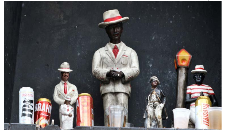
Livro: escritor define entidade como transgressora