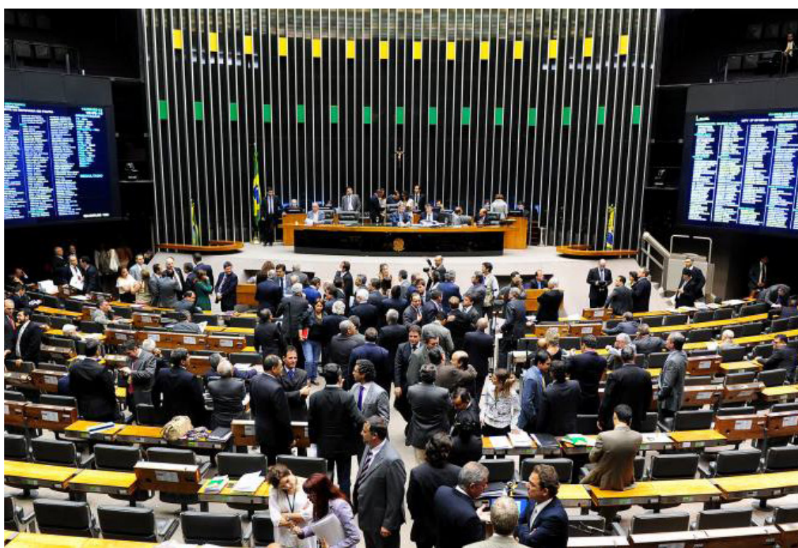
Congressistas querem restringir atuação de pequenos partidos

A iniciativa da Câmara é a que está em estágio mais avançado. O vice-presidente da Casa, Marcos Pereira (Republicanos-SP), disse que