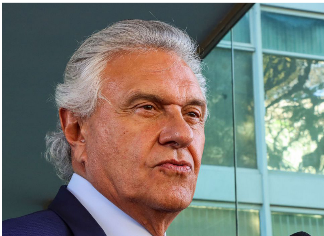
Ronaldo Caiado: o país não pode penalizar estados e municípios

“Gostaria de perguntar aos ‘iluminados’, que fazem reforma no papel e que nunca governaram nada, que deem um exemplo de Conselho Federativo existente no mundo ou onde se tem IBS único (Imposto sobre Bens e Serviços, que deve ser gerido por Estados e municípios, de acordo com o atual texto da reforma), com tarifa igual para todos. Essa situação, que sequestra Estados e municípios, não pode desviar o foco. Temos de lutar para fortalecer os entes federados”, salientou Caiado, ressaltando o cresci-