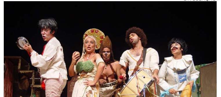
Teatro: cena do espetáculo 'A Cabra', que integra programação