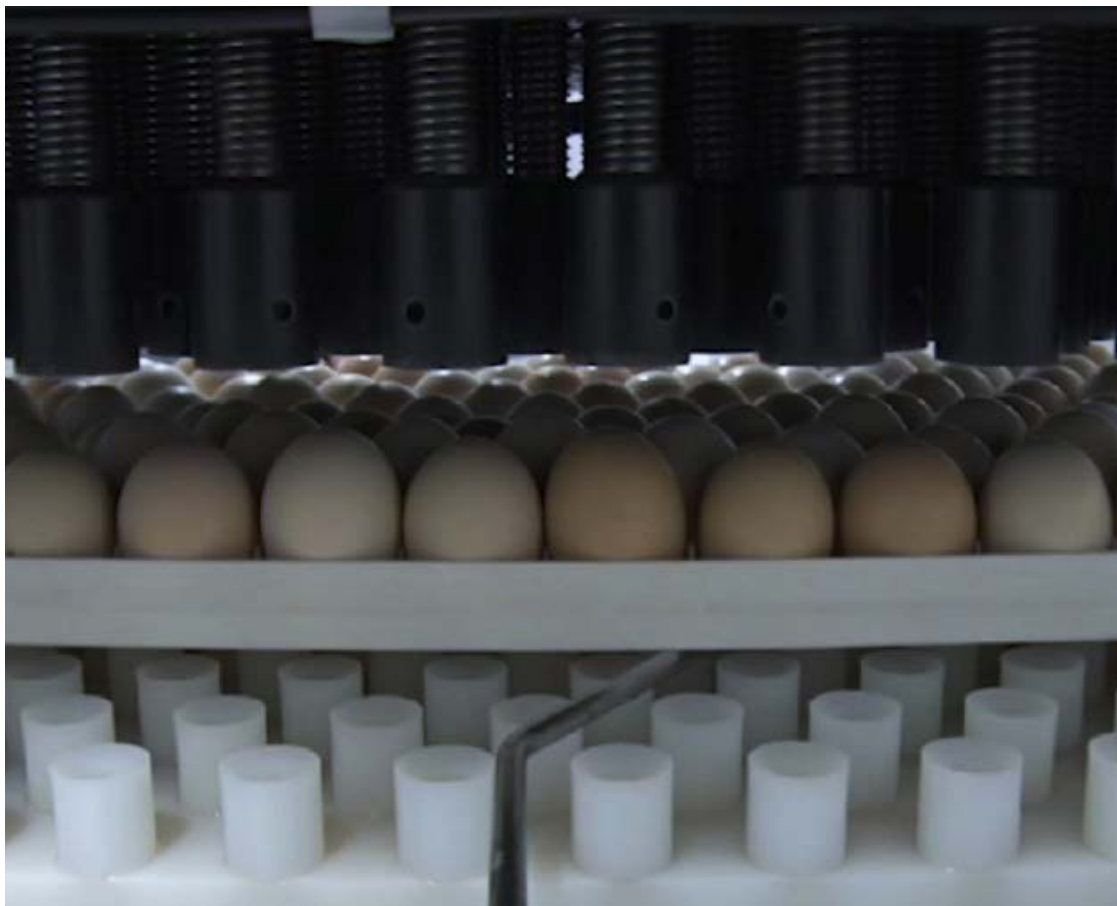
CRESCIMENTO: embarques brasileiros de genética avícola cresceram 45,1%, totalizando US$ 179,9 milhões neste ano

“Os países das Américas são hoje o principal destino dos embarques do setor, que projeta finalizar 2023 com resultados positivos em receita e em volume embarcado”, destaca o diretor de mercados, Luis Rua.