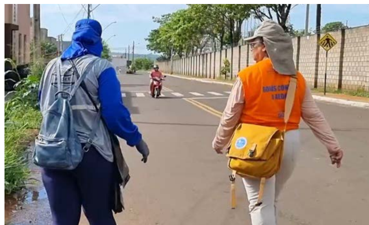
Agentes de saúde durante ação do Manejo Ambiental no Combate ao Aedes, em Jataí

O foco da campanha, segundo a secretaria da saúde, é recolher potenciais criadouros do mosquito Aedes. Portanto, materiais como entulhos de construção, telhas e folhas não fazem parte desse esforço. A destinação correta desses resíduos é de responsabilidade dos moradores, podendo ser descartados nos ecopontos da cidade.