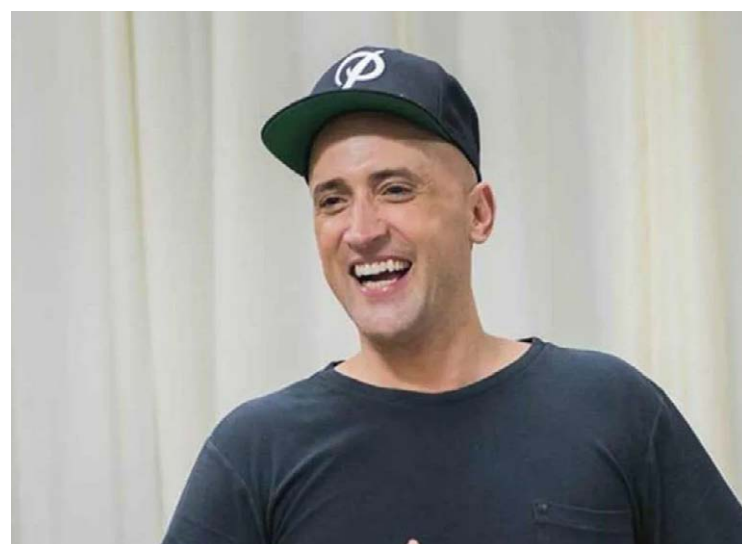
Paulo Gustavo, um dos artistas contemporâneos mais importantes do Brasil, que morreu de covid, teve sua obra homenageada através da Lei Complementar nº 195 que tem como objetivo ações emergenciais destinadas ao setor cultural em decorrência da pandemia da covid-19 — Foto: Reprodução.

Os recursos serão distribuídos entre diversas categorias, abrangendo áreas como artesanato, hip-hop, literatura, música, artes visuais, teatro, circo e dança, entre outras. As inscrições para o edital permanecerão abertas até o dia 8 de novembro. Para os interessados, o regulamento completo pode ser acessado no site oficial da Prefeitura de Rio Verde.