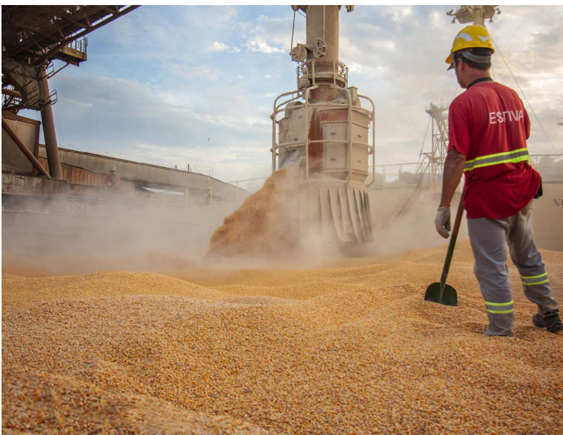
RECORDE E LIDERANÇA: exportações brasileiras de milho devem superar a marca de 50 milhões de t. em 2023, tornando o Brasil o maior exportador do mundo

“Atualmente, estamos próximos das 40 milhões de toneladas, e a projeção é que fechemos outubro com aproximadamente 42,5 milhões de toneladas. Isso significa que o Brasil está a caminho de superar a marca de 50 milhões de toneladas” de milho exportado em 2023, em comparação com os 43-44 milhões do ano anterior”, complementa.