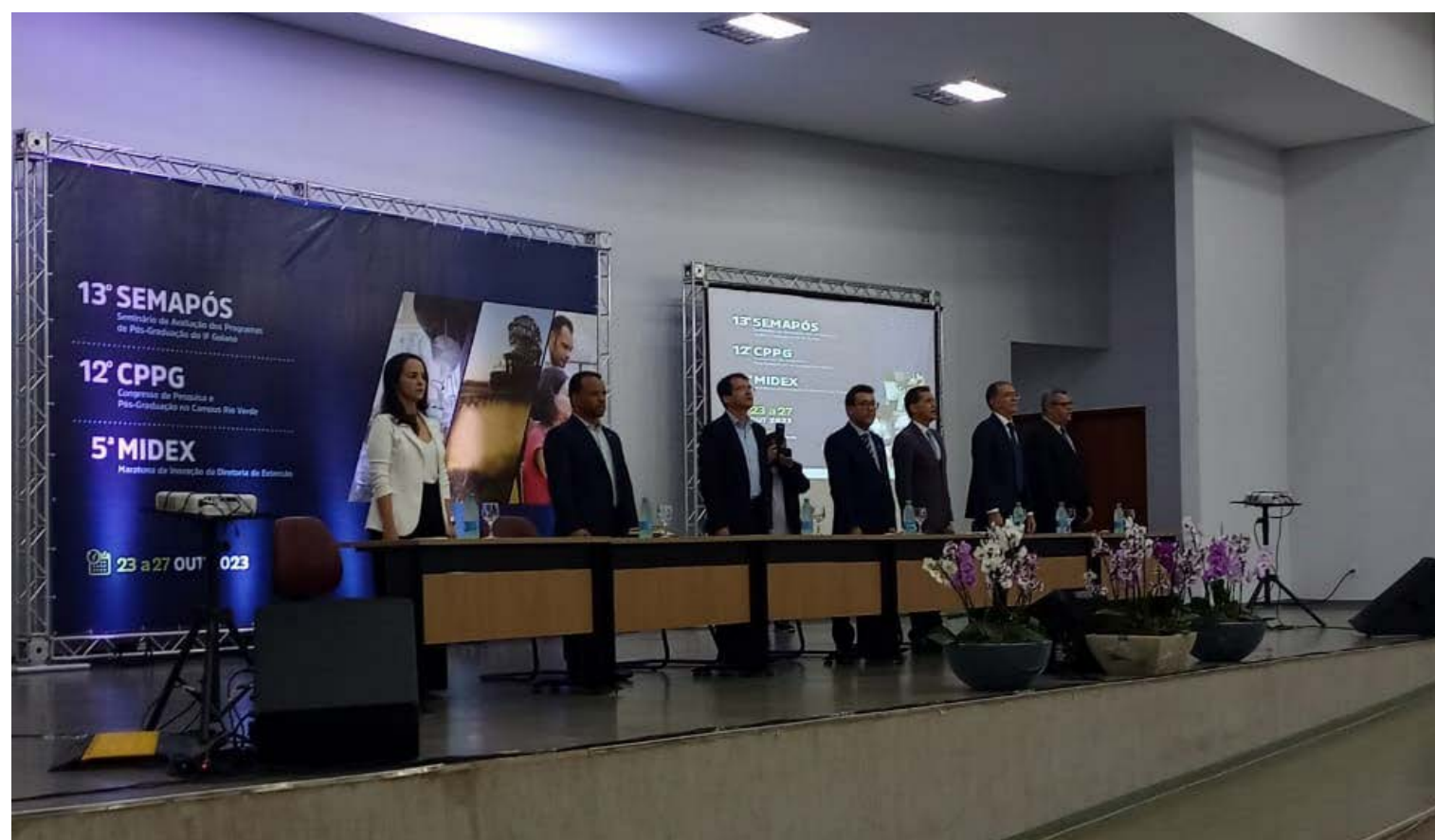
CPPG, SEMAPÓS E MIDEX: Solenidade de abertura dos eventos integrados na sede do IFG Rio Verde

Segundo o especialista, o IF Goiano já apresenta avanços nesse sentido, a exemplo do crescimento da pós-graduação e a materialização da verticalização de ensino. Apesar das melhorias, ele observa que a Rede Federal ainda precisa crescer, com