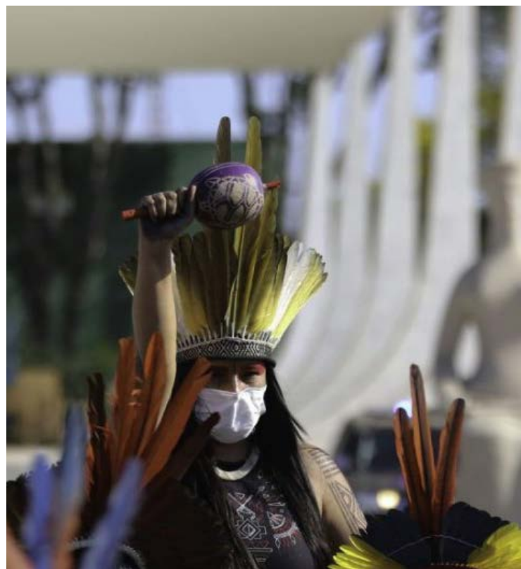
Protestos indígenas durante análise do tema pelo Supremo Tribunal Federal - Foto: Fabio Pozzebom/Agência Brasil.

Os vetos são analisados pelo Congresso Nacional, em sessão conjunta de deputados e senadores. Para que sejam derrubados, é preciso o voto de 257 deputados e 41 senadores.