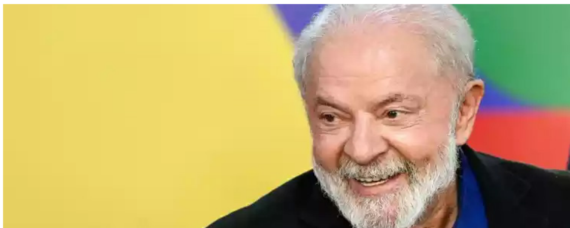
Lula da Silva: governo bem avaliado pelo brasileiro

O levantamento entrevistou 2.000 eleitores por telefone de 12 a 16 de outubro de 2023. A margem de erro é de 2,2 pontos percentuais em um intervalo de confiança de 95%. Por não ser ano eleitoral, não é necessário registro no TSE (Tribunal Superior Eleitoral).