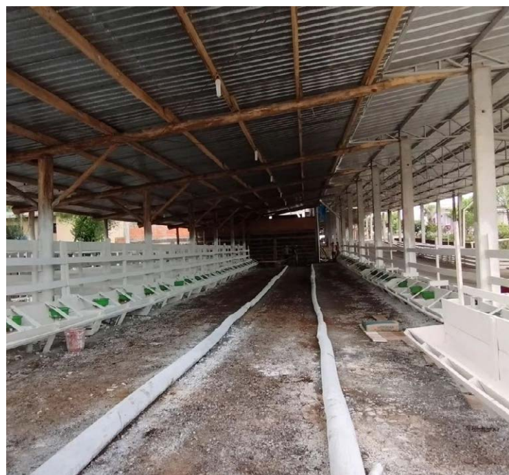
Os galpões da exposição já estão preparados para a Extenoleite 2023 em Santa Helena — Foto: Reprodução.

A Extenoleite é realizada a cada 4 anos e a expectativa é muito grande neste ano. Diversos expositores anunciaram novidades em seus estandes e os produtores rurais irão expor o que há de melhor no gado leiteiro.