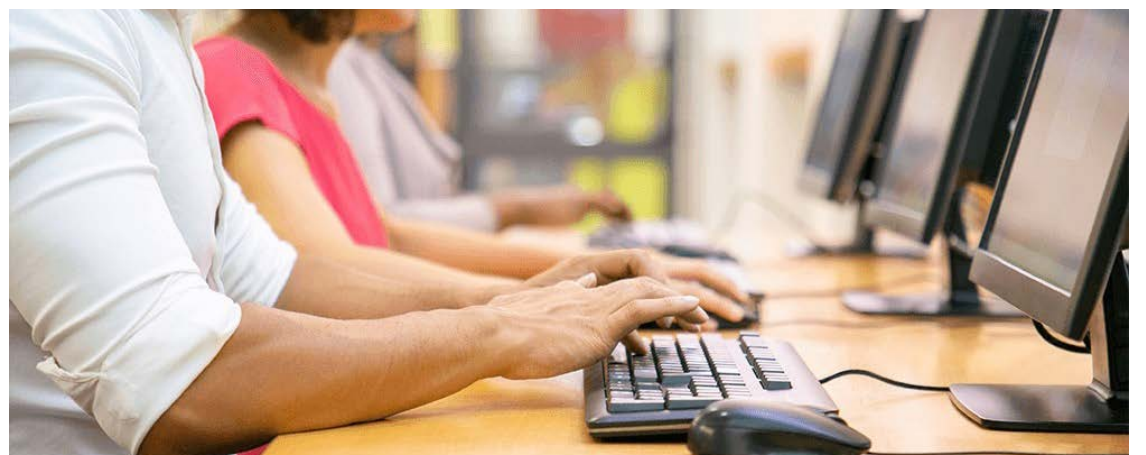
Curso gratuito de informática em Jataí: iniciativa visa proporcionar inclusão digital e aprendizado — Foto: Reprodução.

As aulas ocorrerão durante os períodos matutino ou vespertino, de segunda a sexta-feira, das 8h às 11h e das 13h às 17h. As inscrições encerram no próximo dia 27 de outubro.