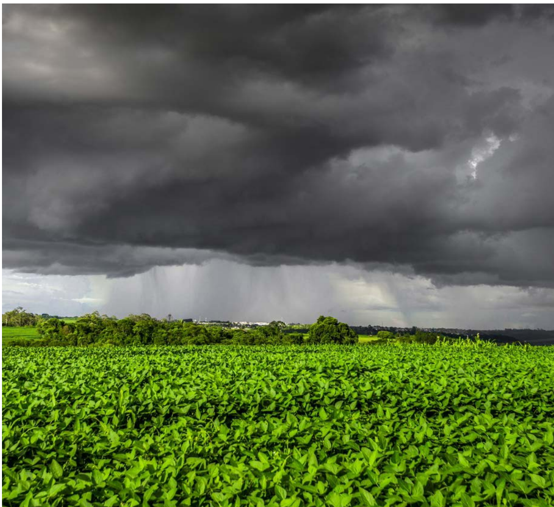
Frente fria gerada pelo ciclone deve avançar rumo ao Centro-Oeste e Sudeste, levando chuvas para essas regiões no decorrer da semana — Foto: Reprodução.

É esperada a ocorrência de chuvas isoladas em grande par-