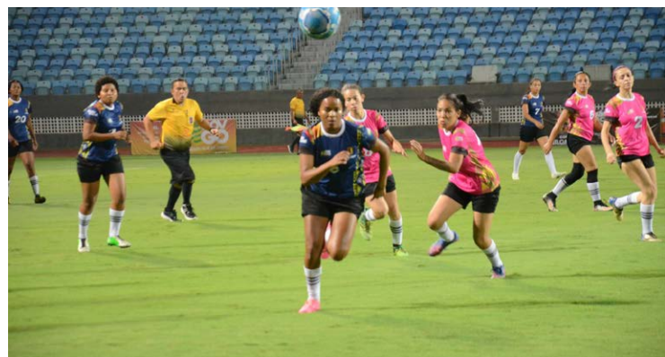
Partidas decisivas da Copa Quilombola ocorreram no Serra Dourada

Dentro de campo, as duas partidas decisivas no Serra Dourada terminaram com o placar de 1 a 0. Na disputa feminina, o Quilombo Vazante, de Divinópolis de Goiás, bateu o Baco-Pari e conquistou o título inédito. No masculino, a Comunidade Vão do Moleque, de Cavalcante, desbancou o Vargem Grande e conquistou o bicampeonato, uma vez que havia vencido a primeira edição.