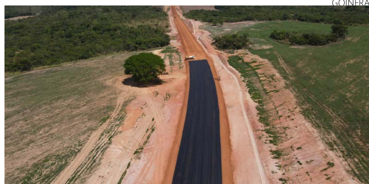
Contorno Oeste de Pires do Rio chega a fase de revestimento asfáltico: obra vai desviar tráfego pesado

A próxima etapa, que é a aplicação do revestimento, contará com camadas de Concreto Betuminoso Usinado a Quente (CBUQ). O material apresenta resistência superior para suportar as tensões do tráfego de longa distância, proporcionando maior vida útil ao pavimento e maior economia.