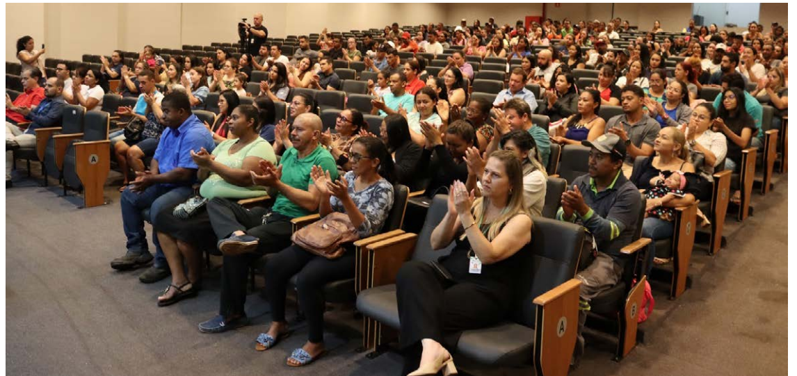
Moradores contemplados pelo programa “Parcerias” - Minha Casa Minha Vida, no Residencial Lázaro Pimenta — Foto: Reprodução.

Atualmente, o município trabalha com dois programas habitacionais como o Parcerias, que passará a se chamar “Cidades, iniciativa da prefeitura em parceria com o gover-